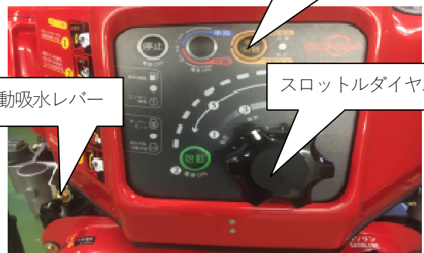
スロットルダイヤル